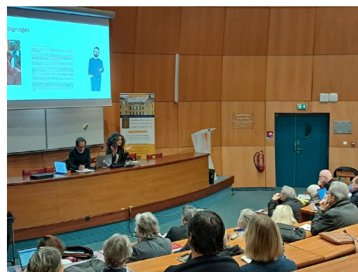
À l'Université d'Artois, avec le « grand public ».