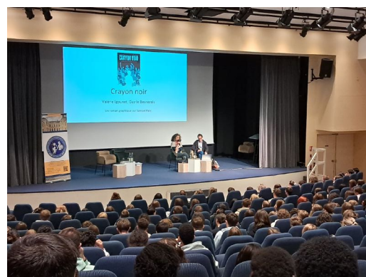
À l'ATRIA, avec les lycéens des lycées Robespierre et Guy Mollet, et dans le jardin citoyen du collège Charles Péguy.